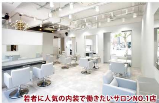
若者に人気の内装で働きたいサロンNO.1店