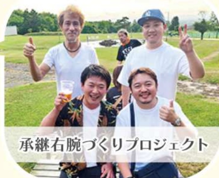
承継右腕づくりプロジェクト

承継右腕づくりプロジェクトでは、承継に関する疑問やエピソードなど、会員たちを取材して発信しています。等身大のリアルな本音トークをぜひご参考になさってください。