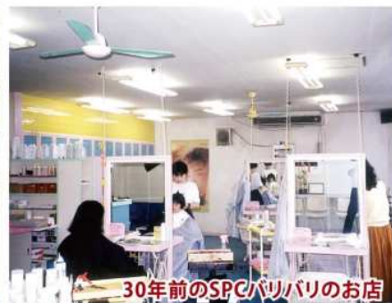
30年前のSPCバリバリのお店