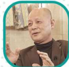
中部統括長野本部