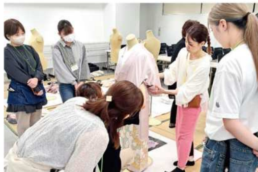
各地の講習の様子