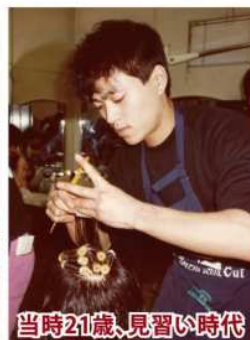
当時21歳、見習い時代