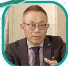
中央統括埼玉本部