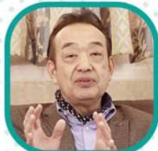
中央統括千葉本部