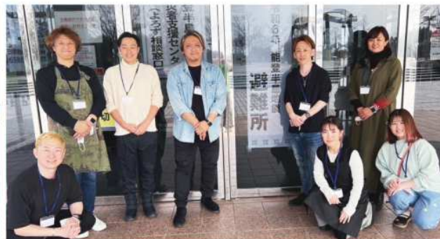
「令和6年能登半島地震」のボランティア活動の写真