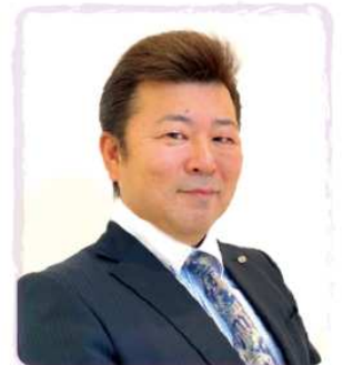
第32代 国際部 副理事長

この度、五十嵐会員の御協力によりSPC 韓国会員も参加されている韓国の美容室経営者の団体に向けて技術講習会ができました。これを機会にSPC 韓国に2名入会があったことも報告いたします。 SPCは「人間形成と仲間づくり」が基本にあり、これは海外においても同じです。また32代理事長が掲げた「垣根を越えて他団体と繋がろう」の基本方針を、さらに国も超えて繋げることができました。 SPCを知らない韓国の美容室経営者130名にお伝え出来たことは過去最大規模だったのでないでしょうか。これはSPC 韓国の会員が基本軌道・理念を理解し、組織を拡げようと行動した結果です。是非皆さんも海外の会員と交流をしてください。そこには新たな可能性が確実にあります。