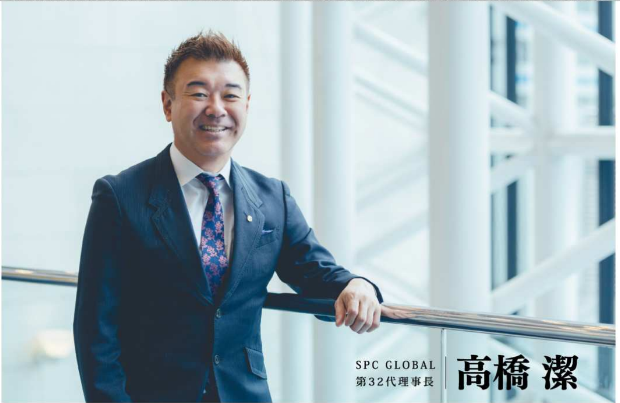
SPC GLOBAL 第32代理事長