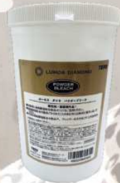
ルーモスダイヤパウダーブリーチ 医薬部外品 脱色剤